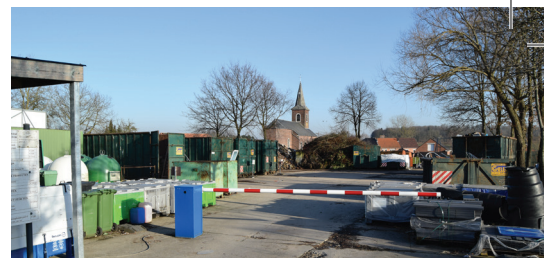
Containerpark niet meer thuis in Opheers p. 3