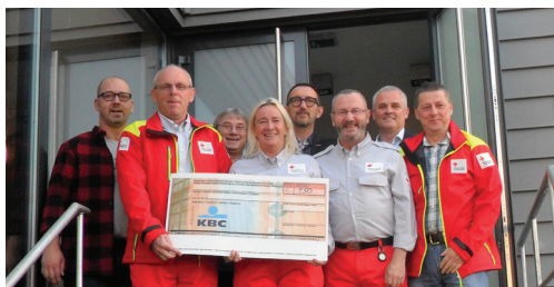
N-VA schenkt 250 euro aan Rode Kruis p. 2