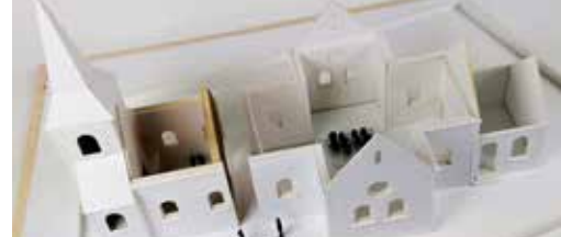
Herbestemming voor kerk p3